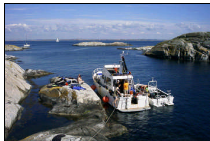
Dykläger på Väderöarna i Bohuslän