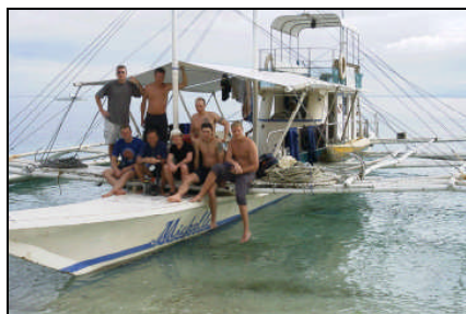
Visaya dyksafari i Filippinerna